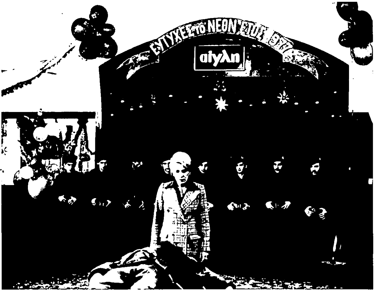
Les Chasseurs de Théo Angelopoulos.

Notes sur la trilogie de Théo Angelopoulos ( Jours de 36, Le Voyage des Comédiens, Les Chasseurs )